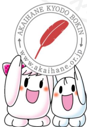
愛ちゃんと希望くん

募金で集まったお金は、お年よりや障がいがある人のお手伝い、またボランティア団体の活動に使われます。