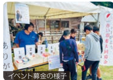
イベント募金の様子

歳末たすけあい募金は、ひとり暮らし高齢者などへの歳末訪問活動や、ぴおーらキッチンの食材費、小・中学校などへの図書カード配布活動等に活用させていただきました。