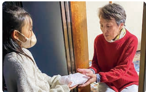
お祭りのご馳走のお裾分け