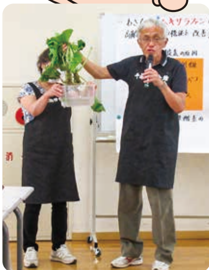
7月 講話・試食 「根茎わさび驚きの健康パワー」