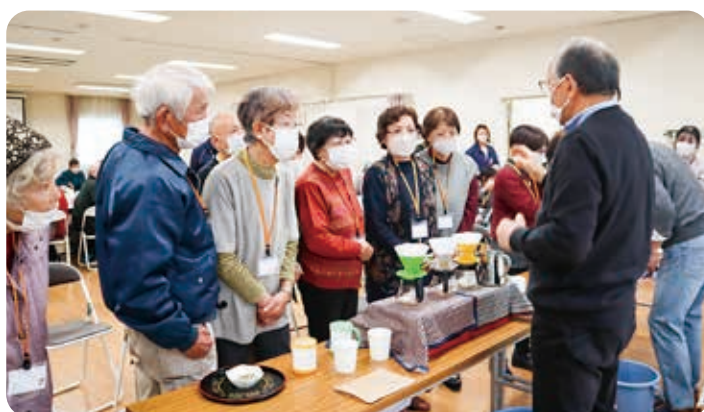
11月 講話・試飲「コーヒーと認知症」