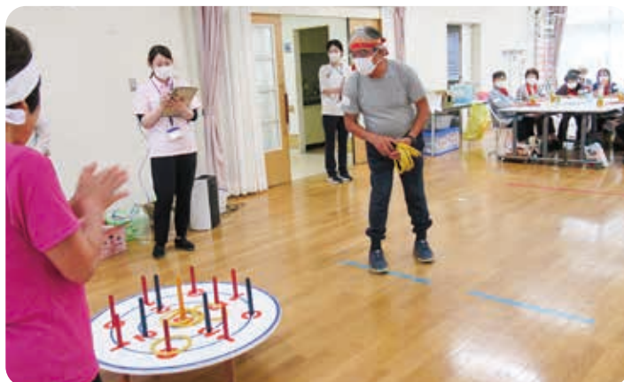
9月 ミニミニ運動会